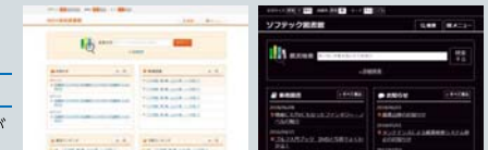
デザインパターン見本