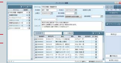
ブックリスト編集画面